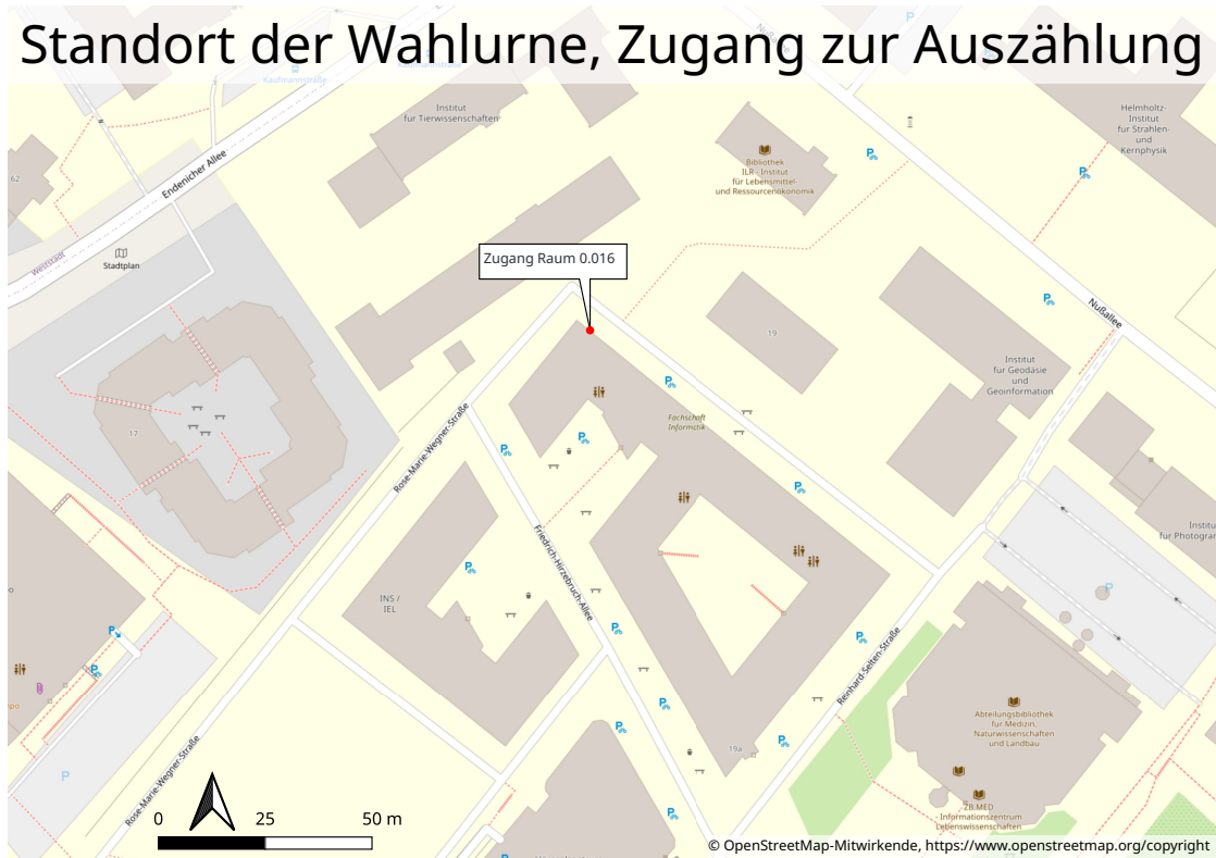
Abbildung 3: Zugang zur Wahlurne